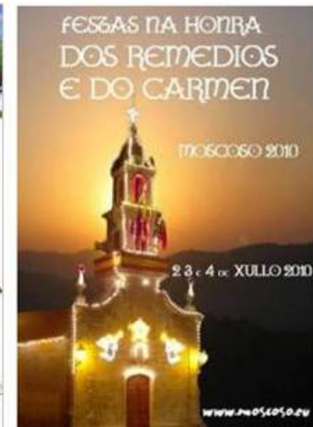
Carteles y Libros de Fiestas locales

Sellos editados por la Real Casa de Moneda y Timbre